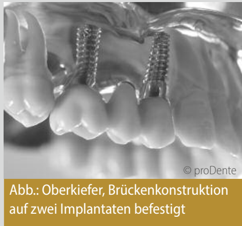
Abb.: Oberkiefer, Brückenkonstruktion auf zwei Implantaten befestigt

Abb. oben: Oberkiefer, unversorgte Zahnlücke;